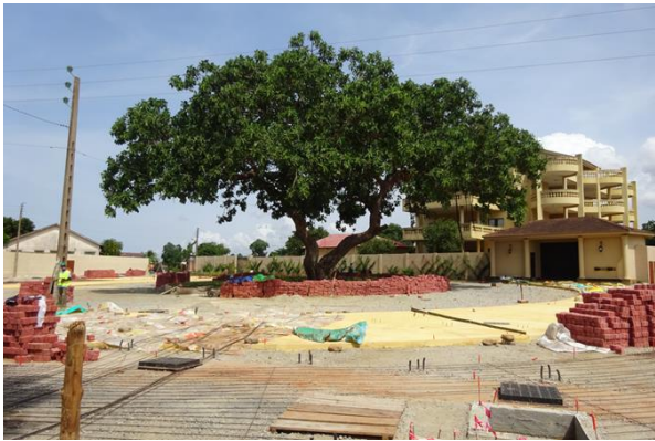
Place Chacha, 05/2021

Architecte paysagiste de la place Chacha (landscape-consulting.com)