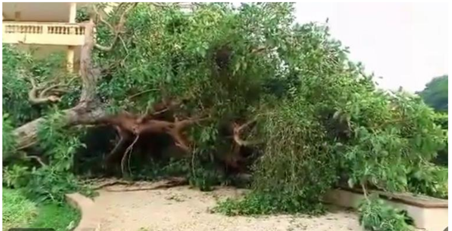
Catastrophe à la Place Chacha, 06/2024